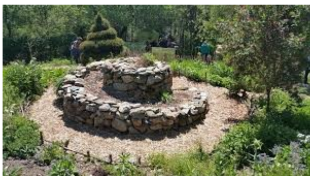
Exemple proposé par les jeunes du CMJ

La spirale aromatique serait fabriquée en pierre. Elle mesurerait 80 cm de hauteur. Plusieurs configurations sont possibles (escalier plus ou moins long et large). Exemple de modèle ci-dessous :