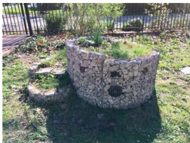
Exemple du jardin botanique Henri Gaussen à Toulouse

Une quarantaine de plantes pourront être plantées dans la spirale.