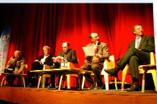
< Conférence-débat sur la bioéthique à l'Éden