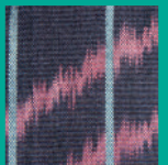
TEINTURE & TISSAGE Une tradition millénaire Une approche contemporaine