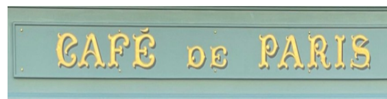
Enseigne avec des lettres peintes